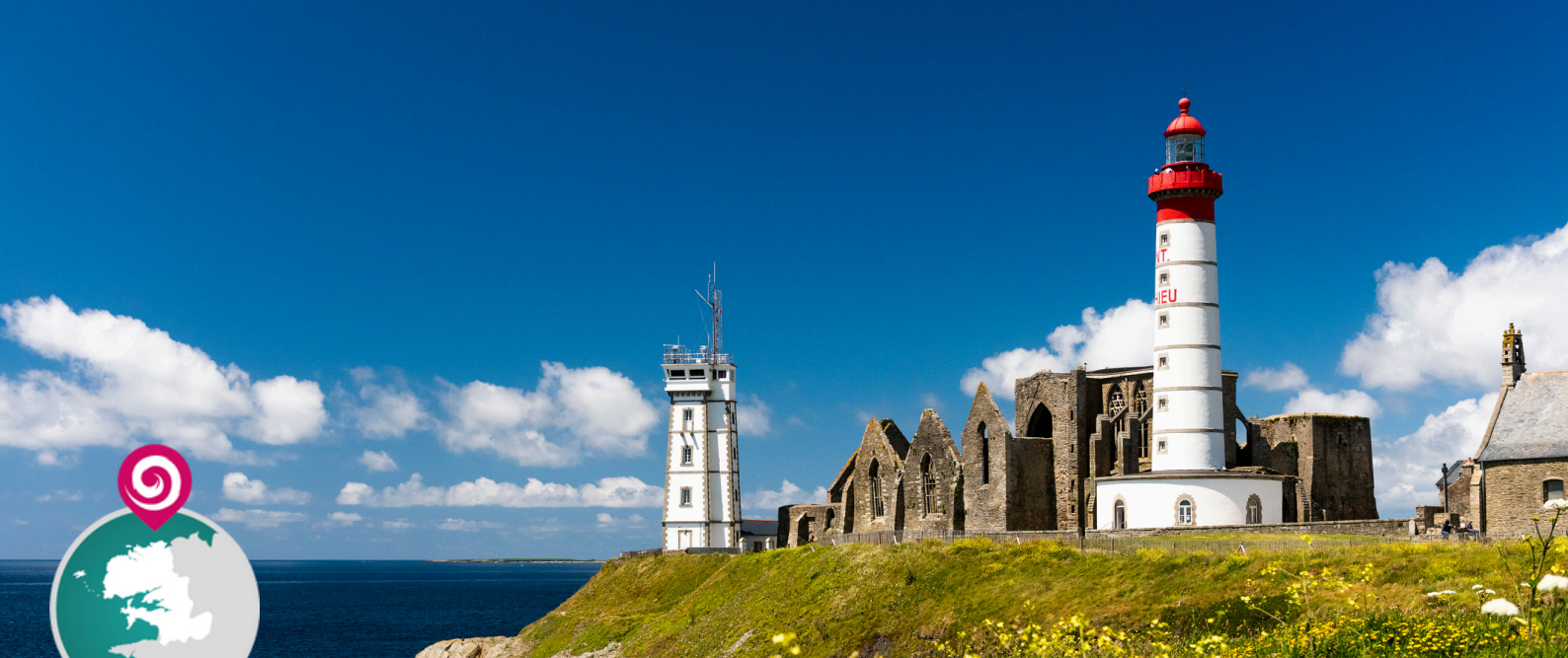
Phare de Saint-Mathieu à Plougonvelin