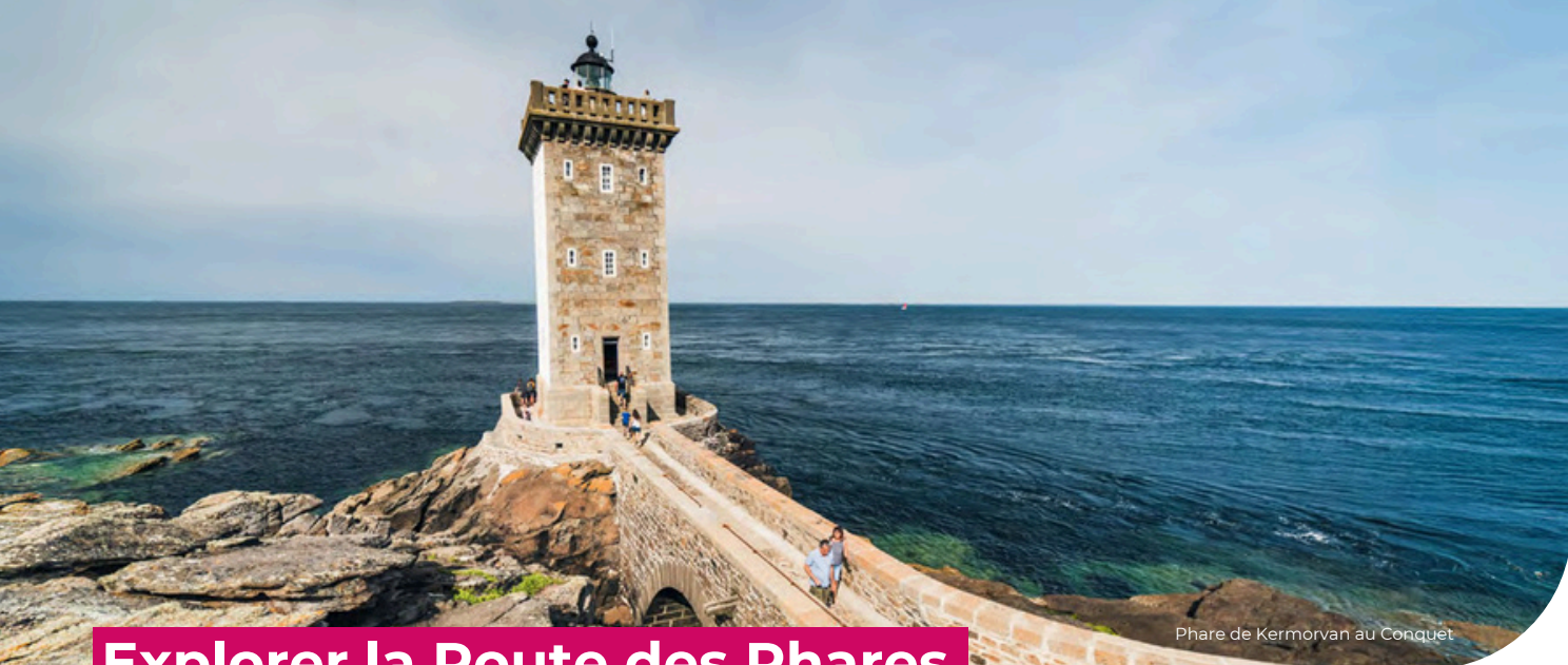
Phare de Kermorvan au Conquet