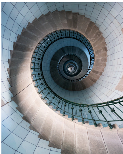
Phare de l'île Vierge à Plouguerneau

Le phare de l'île Vierge à Plouguerneau est le plus haut d'Europe avec ses 82,5 m de haut et les 383 marches de son escalier emblématique en opaline. Le phare se visite d'avril à octobre (accès en bateau ou en kayak). Possibilité de visite par casque en réalité augmentée pour les personnes à mobilité réduite. Pour vivre une expérience hors du temps, notre conseil : louer l'éco-gîte, l'ancienne maison des gardiens au pied du petit phare (le 1er de l'île), et pouvoir se vanter d'avoir eu un phare et une île rien que pour vous – ou presque, le gîte pouvant accueillir 9 personnes. Réservation auprès de l'Office de Tourisme du Pays des Abers. En savoir plus