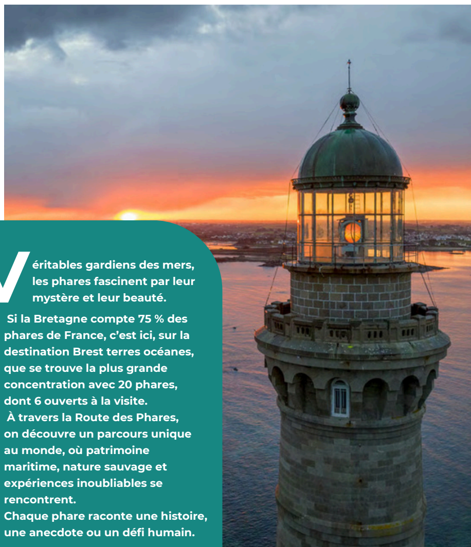
Phare de l'île Vierge à Plouguerneau

V éritables gardiens des mers, les phares fascinent par leur mystère et leur beauté.