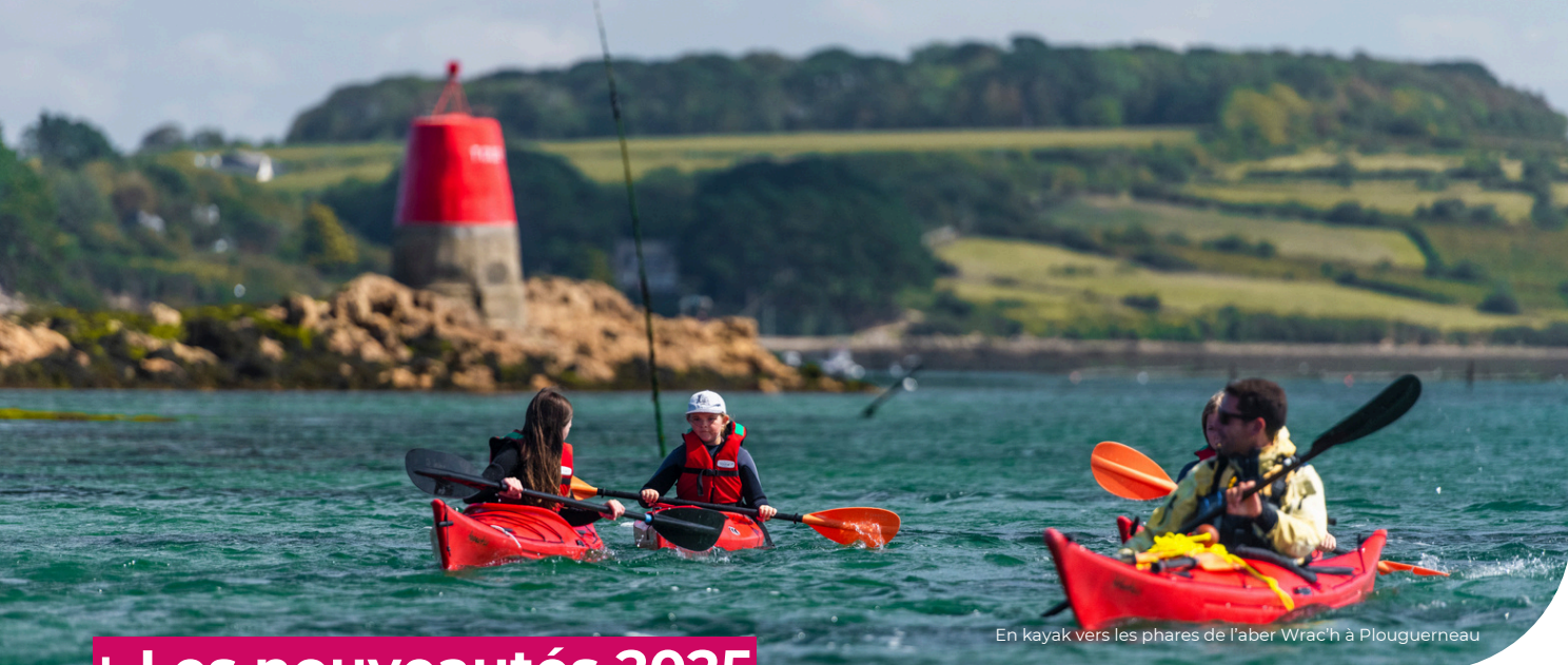
En kayak vers les phares de l'aber Wrac'h à Plouguerneau