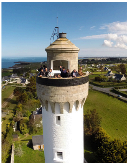
Le Phare de Trézien à Plouarzel

Le phare de Saint-Mathieu à Plougonvelin, facilement reconnaissable avec sa silhouette singulière émergeant aux côtés des ruines de l'abbaye médiévale. Ce phare de 37 m de haut se visite toute l'année, de jour, mais aussi de nuit. En effet, l'été et pendant les vacances scolaires, des visites nocturnes permettent d'observer la mer d'Iroise, l'une des plus éclairées au monde avec le ballet lumineux de ses phares ! Des visites sur le thème des naufrages en mer d'Iroise, une nouvelle scénographie, des jeux de piste et des visites virtuelles seront les temps forts de 2025. En savoir plus