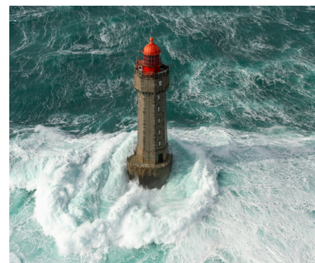
Phare de la Jument à Ouessant

Dans ce territoire préservé et sensible qu'il faut protéger, on optera pour des activités douces pour aller de phare en phare : à pied sur l'incontournable GR®34, à vélo via la Véloroute La Littorale V45 ou encore par la mer lors d'excursions en voilier traditionnel, semi-rigide, kayak ou paddle. Et pourquoi pas tout simplement la contemplation, respirer, admirer et se rappeler que le patrimoine bâti et la nature sont des trésors à protéger.