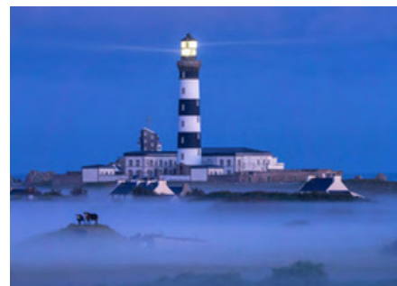
Phare du Créac'h à Ouessant

Le phare de Trézien à Plouarzel : Du haut de ses 37,20 mètres, ce phare offre depuis sa lanterne une vue spectaculaire du phare de Saint-Mathieu au phare du Four, des îles de la Mer d'Iroise à la pointe de Corsen. Pour profiter du panorama il vous faudra gravir ses 182 marches en pierres de taille en granit de l'Aber Ildud ! Le phare de Trézien est actuellement en travaux, réouverture prévue à partir d'avril. En savoir plus